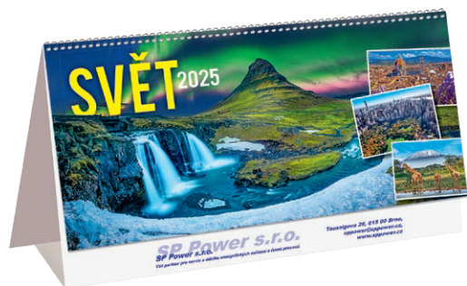
Cenník reklamnej potlače vybraných papierových výrobkov sieťotlačou – lišty na nástenné kalendáre, stolové kalendáre, novoročenky, papierové tašky do 200 cm 2 a krabice na víno