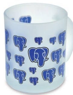
Cenník rotačnej sieťotlače – hrnčky, termosky apod.